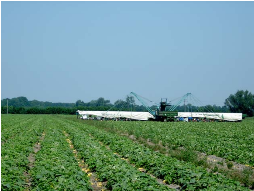
Gurkenernte im Spreewald – Foto: M. Petschick 07/2005

Die Spreewaldregion umfasst eine der wertvollsten Kulturlandschaften Europas im südlichen Brandenburg. Das Zentrum der Region mit einer Größe von 3.127 km 2 bildet das von der UNESCO anerkannte Biosphärenreservat Spreewald mit einer Fläche von ca. 480 km 2 . Etwa 35 % der Region besteht aus Gebieten mit nationalem und internationalem Schutzstatus wie Landschafts-, Naturschutz-, FFH und SPA Gebieten. Das Biosphärenreservat Spreewald wird dabei als sogenanntes NATURA 2000 Gebiet hervorgehoben. Mit über 800 Landwirtschaftsbetrieben aller Rechtsformen werden in der Region 131.190 ha landwirtschaftliche Fläche bewirtschaftet, wobei ca. 30% dieser Flächen den strengen Kriterien des ökologischen Landbaus unterliegen. Die Agrarwirtschaft der Region hat sich damit den besonderen Bedingungen einer standortangepassten Produktion gestellt und dies im Leitprojekt einer regionalen Dachmarke Spreewald mit entsprechenden Selbstverpflichtungen bestimmt.