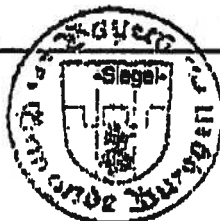
J. Schuster, Erster Bürgermeister